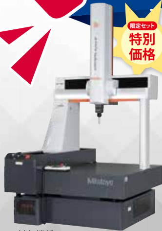
対象機種 CRYSTA-Apex V500/700シリーズ 設置台仕様

CRYSTA-Apex V500/700シリーズ 限定セット and MiSTAR 555 限定 セット特別価格! スタイラスキット+ウェアラブル万歩計 プレゼント!