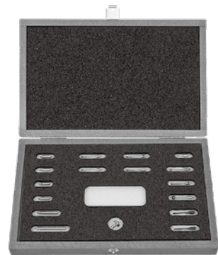
写真は②スタイラスキットM2

※プレゼント②は数に限りがございます。なくなり次第、プレゼント①のみとなります。