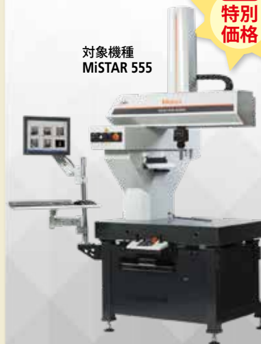
対象機種 MiSTAR 555