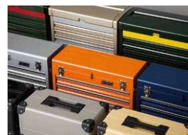
2022 SK SALEで限定された特別カラーは全9色。EK-10Aに2色、EK-R-103に4色、SKX0213、SKX2613に3色と、ストレージによって、限定カラーが異なります。

もっと自由な発想でツールケースを選んでもらいたいと、SK SALEでは毎年、特別カラーのストレージ&ツールセットを期間・数量限定でラインナップ。直感やラッキーカラーで選ぶもよし、愛車やインテリアとコーディネートするもよし。選ぶ楽しさから、あなたの工具時間はスタートしています。