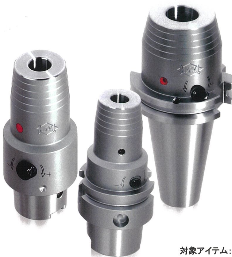
対象アイテム：従来型 MHC hidroチャック