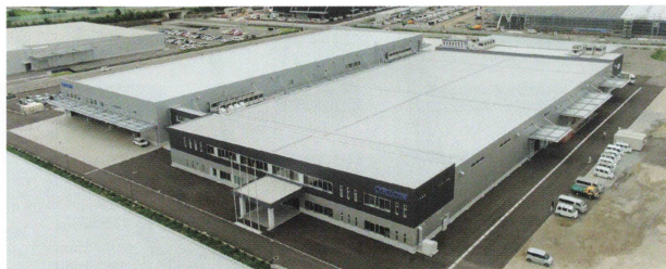
須坂インター工場 2024年3月竣工