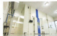
イノベーションセンター 省エネ低高温試験室 2024年4月竣工

上記時刻はオリオン機械 / 本社工場バス発着時刻です。インター工場へはシャトルバスでの移動となります。工場間のバス移動は片道5分程度です。