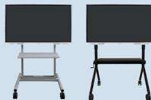
T-K5342 (標準スタンド) T-K6047-Y (昇降スタンド)